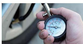
タイヤを適切に扱うノウハウを知ることでタイヤに関するさまざまな疑問が解決されます。