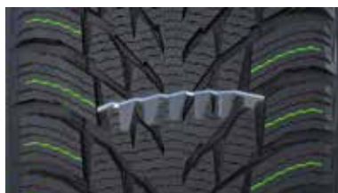
コーム（櫛）サイピング