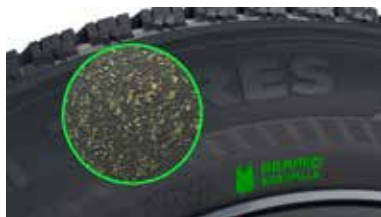
アラミドサイドウォール

SUV 用には、先代 R2 SUV 同様、「アラミドサイドウォール」を採用。アラミドは、飛行機の機体や防弾チョッキに使われる、非常に軽量で強度の高い化合物。外部の衝撃に対しての強度を上げ、耐パンク性能を向上しています。