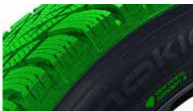
クライオクリスタルコンセプト3

細かく強固な粒子をトレッドコンパウンドに埋め込み、氷を掻くことでグリップを確保します。トレッドが摩耗しても下から新しい粒子が顔を出し、使用期間中に効果が弱まることはありません。環境にやさしい素材を使用しており、自然に悪影響を与えることはありません。