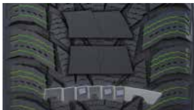
3D ロックサイピング

「3D ロックサイピング」「コーム（櫛）サイピング」や、センターリブに 3 種の異なる形状のサイピングを施すことにより、ブロックの動きを軽減し安定性を高めました。