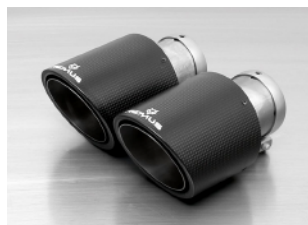
Φ102 アンゲル W