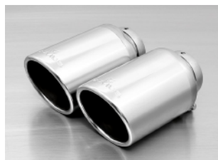
Φ102 カーボン アンゲル W

ショットブラスト表面処理による高い耐久性 オールステンレス製 背圧を低減し出力向上 バルブコントロールシステム搭載 【eマーク】付き車検対応マフラー